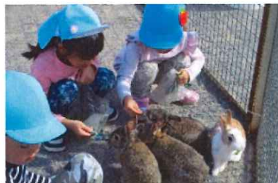
そーつとさわったらフワフワだったよ

園だけではできない経験を重ねることで、子ども達に色々な思いが育まれていきます。世代を超えて交流や体験をさせて頂けることに感謝の思いです。これからも、是非お声を掛けて下さい。地域と共に歩んでいきたいと思っております。