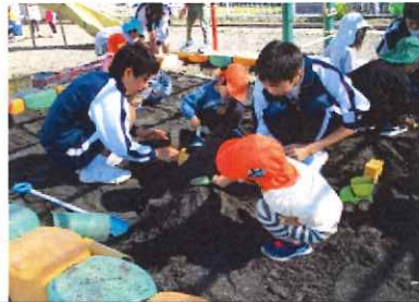
絵本やゲームをいっぱい作ってきてくれたよ ♡ 砂場でも遊んだね