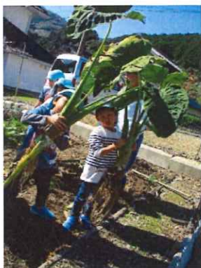
見てみて、傘みたいな葉っぱ