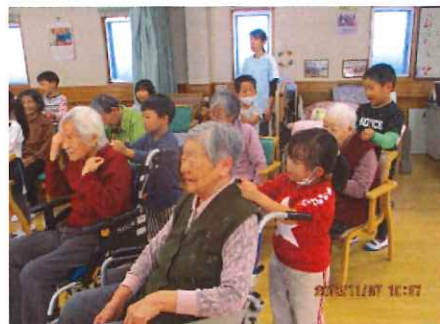
一緒に手遊び、ちよっぴりドキドキ