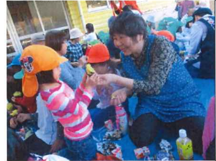
おばあちゃん ありがとう