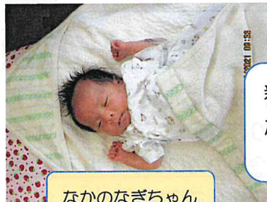
新しいおともだち たくさん遊びに来てね♡