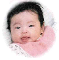
そのだ ふぶきくん